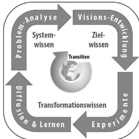
Abbildung 2: Transition Circle (Quelle: in Anlehnung an Schneidewind u.a. 2011, auf Basis des ursprünglichen Transition-Zyklus von Loorbach 2007; 2010)

In Realexperimenten wird Wissen zwischen kontrollierten Bedingungen und situationsspezifischen Kontexten generiert.